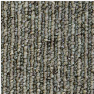
^ 925 50 x 50 cm