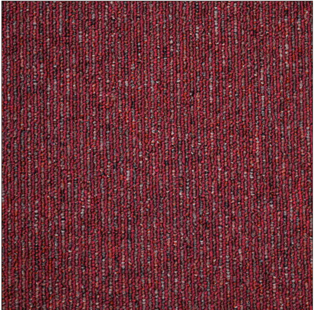
^ 185 50 x 50 cm