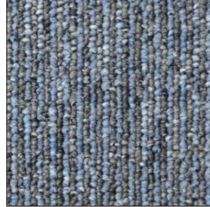
^ 375 50 x 50 cm