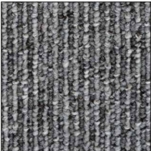
^ 955 50 x 50 cm