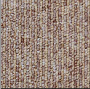
^ 825 50 x 50 cm