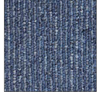
^ 365 50 x 50 cm