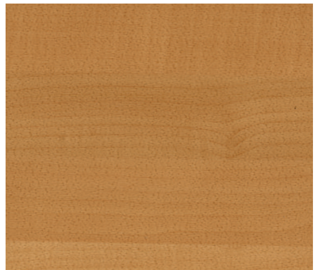
6058 American Oak