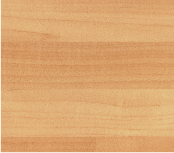
6062 Canadian Maple